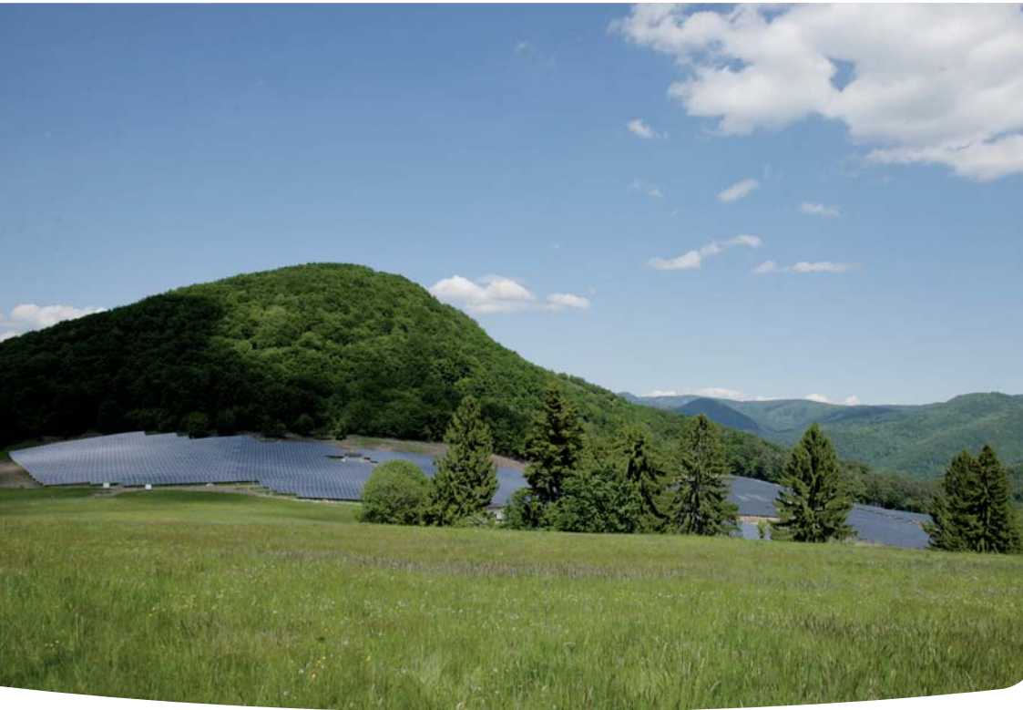
Jastrabá 1, dodávka fotovoltaickej elektrárne, PS 02 elektrická káblová prípojka 22 kV

Pozrite sa na výber najdôležitejších projektov, ktoré sme realizovali v uplynulých rokoch.