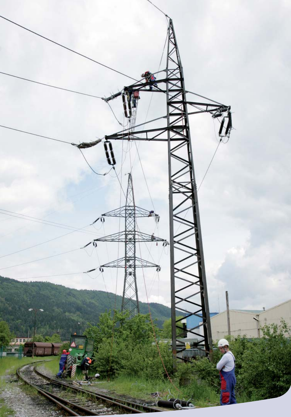
Žilina, Tr Varín-Hc Hričov, Preizolácia vedení 110 kV a montáž ochranných špirál

Reinsulation of 110 kV lines and assembly of protection spirals